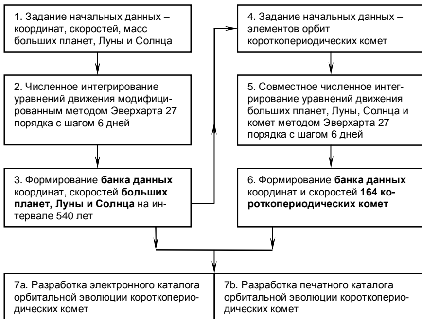
Рис. 2. Схема формирования банков данных координат и скоростей.

При решении уравнений движения комет необходимо иметь информацию о координатах и скоростях, как исследуемого тела, так и всех возмущающих тел на определенные моменты времени. Для этого было необходимо создать банк данных координат и скоростей больших планет, Луны и Солнца, который позволил существенно повысить эффективность программы в связи с тем, что отпала необходимость в вычислении параметров возмущающих тел на больших интервалах времени. Структурная схема проведенных исследований показана на рис.2.